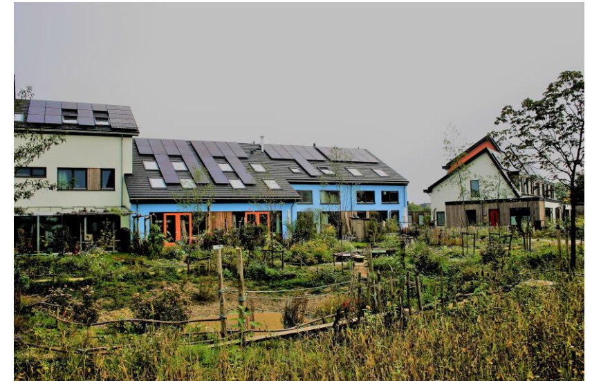
Ecowijk Mandora, Houten 36 duurzame huishoudens