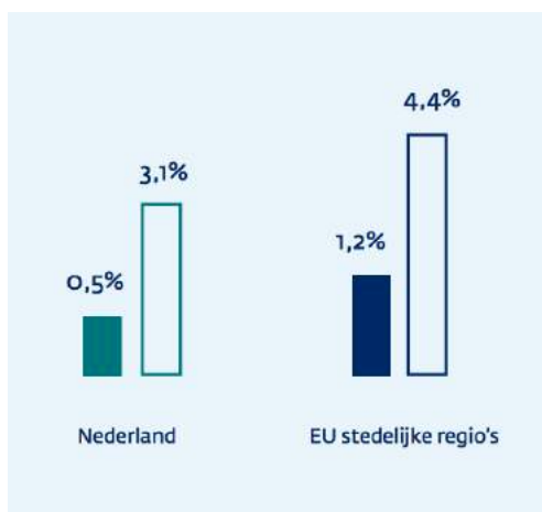
Figuur 6: Werkgelegenheid high-tech industrie/kennis-intensieve diensten In high-tech industrie als percentage van de totale werkgelegenheid 2014 – in doorzichtige balk: Werkgelegenheid in kennis-intensieve diensten als percentage van de totale werkgelegenheid 2014

Cruciaal is het slaan van bruggen tussen onderzoek, ontwikkeling en valorisatie. Uit de Erasmus Concurrentie en Innovatie Monitor 2016, gepubliceerd 24 november 2016, 8 blijkt dat bedrijven in Nederland in de afgelopen 10 jaar nog nooit zo weinig geld hebben uitgegeven aan onderzoek en ontwikkeling van nieuwe producten en diensten. Dit jaar (2016) gemiddeld een wel heel magere 2,1%. Dat moet veel beter kunnen. Tegen 2020 zullen bedrijven het grootste deel van hun R&D uitgaven hebben verschoven van producten naar software en diensten (2016 Global Innovation 1000 Study, PwC 9 ). Een rol van de overheid kan zijn om in plaats van de geijkte subsidies revolverende fondsen te ontwikkelen van waaruit rente-arme leningen worden verstrekt om zo onderzoek & ontwikkeling – innovatie- te stimuleren. R&D zet geld om in kennis. Met die kennis kan een bedrijf innovatiever worden, transformeren en die kennis weer gaan omzetten in waarde.